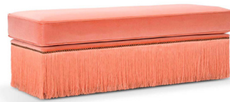
Pouf Dione 120x45