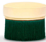
Pouf Dione D50