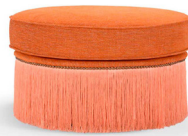
Pouf Dione D70